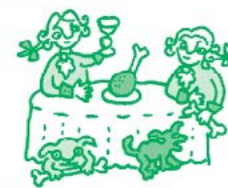
Пир у Потёмкина