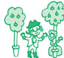
Прогулка в парке