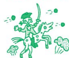
Сражение при Кинбурне

Как думаешь, какое событие описывает здесь Суворов?