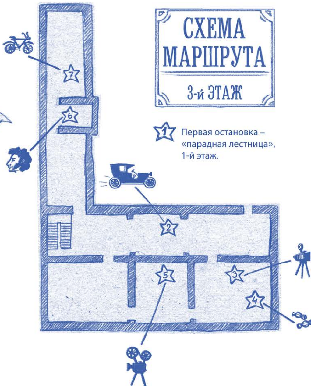
СХЕМА МАРШРУТА 3-й ЭТАЖ

1 Первая остановка – «парадная лестница», 1-й этаж.